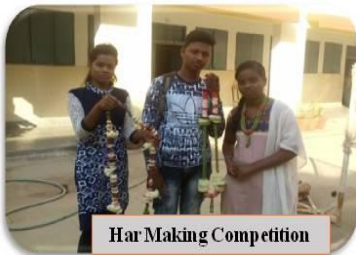
Har Making Competition