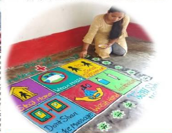
Online Rangoli Competition