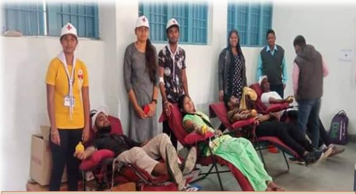
Blood Donation Camp