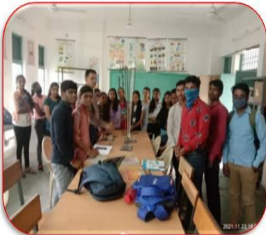
CHEMISTRY PRACTICAL 2021-22