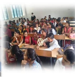
शासकीय कालेज बागबाहरा में रक्तदान शिविर सम्पन्न