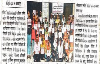
शिक्षण में लक्ष्य बनने में युवा रक्तदान शिविर