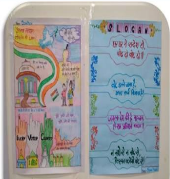
Poster Making Competition